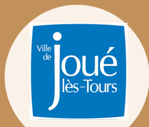
Ville de JLT