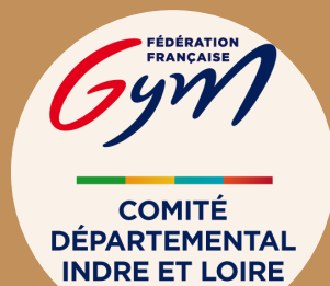
FFGYM & CD 37